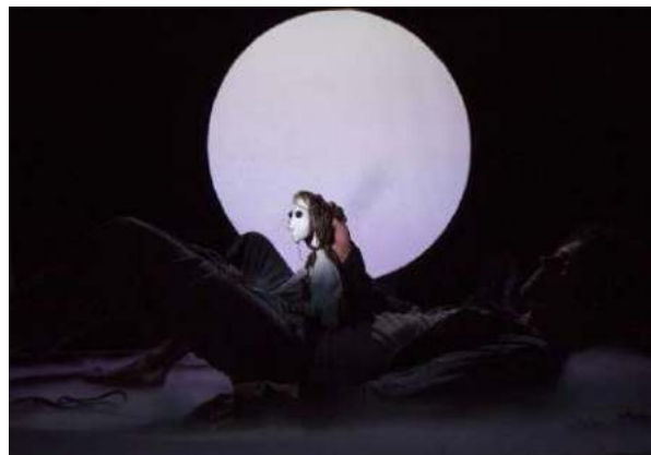
Les Saisons © Claude Boisnard