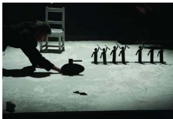
Hamlet Machine © Fred Hocké