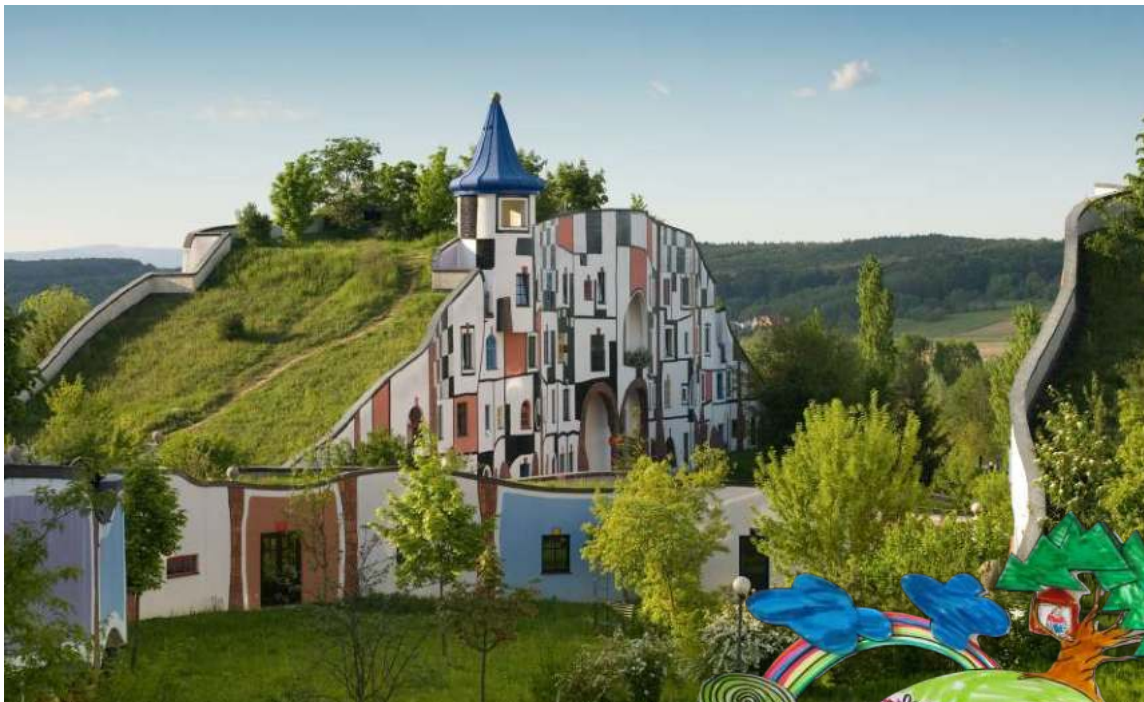
Hundertwasser - Village thermal de Blumau