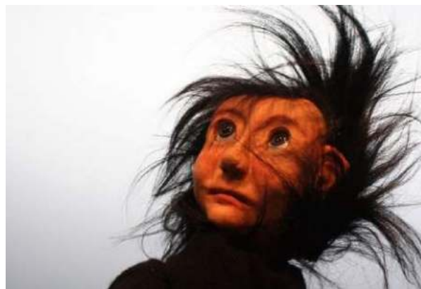
Oscar Piano © Max Legoubé