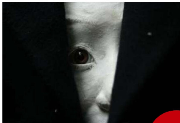
K © Max Legoubé

Plus d'information sur le site de la compagnie : www.compagniesanssoucis.com contact@compagniesanssoucis.com / 06 17 77 39 31