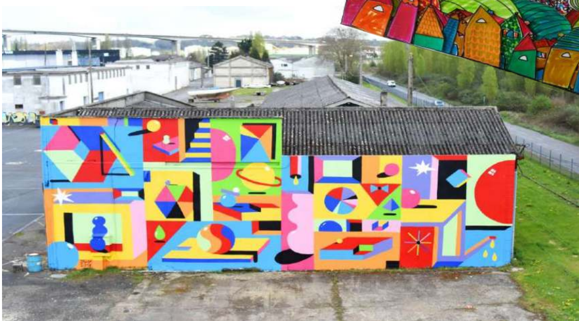
2SHY, graffeur, festival PALMA à Caen